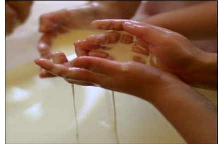
... durch forschen